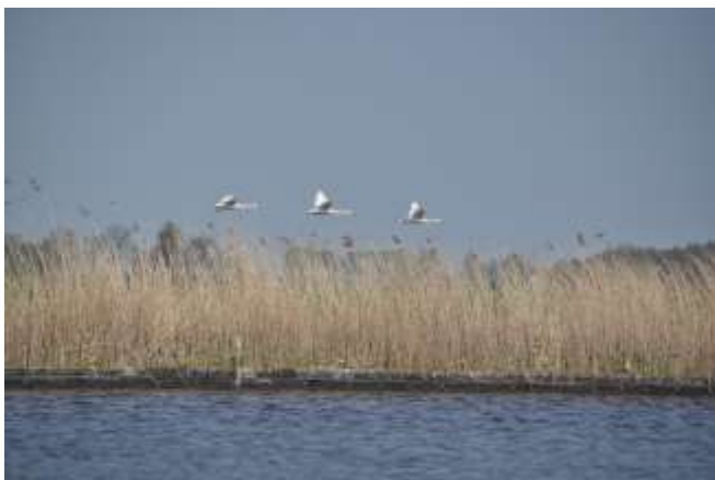
3 zwanen die langs vlogen. Een geweldig gezicht.

Natuurlijk zijn we ook weer een weekend naar de Kikkert in Friesland geweest. Genieten was het met een grote G . Mooi weer, goede vangsten, prachtige natuur.