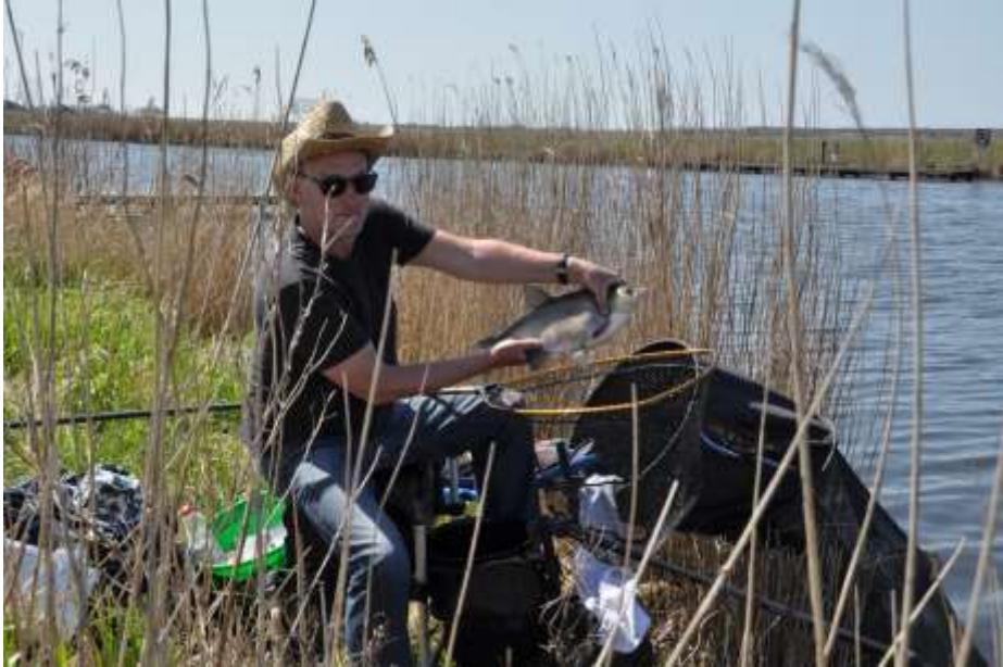
Tussen het riet, in een prachtige natuur, wat wil een visser nog meer.