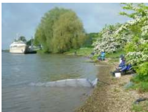
Hier staan de meidoorns prachtig in bloei.

Onder vaak mooie omstandigheden werden wedstrijden gevestigd.