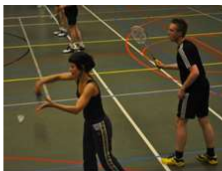
Foto impressie van de eerste speelavond: http://www.mijnalbum.nl/Album=QIMBY168

Foto impressie van de tweede speelavond: http://www.mijnalbum.nl/Album=CSRJAZJU