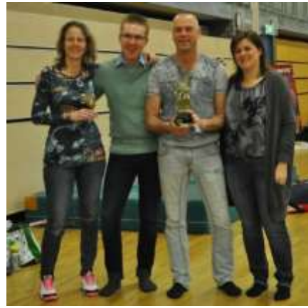
Foto-impressie van deze dag: http://www.mijnalbum.nl/Album=8PJW6MZQ