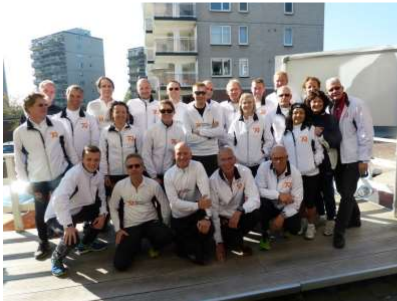
Dordrecht City Run