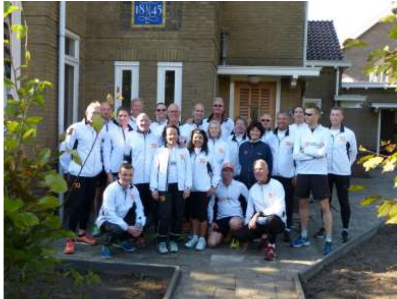
Dordrecht City Run